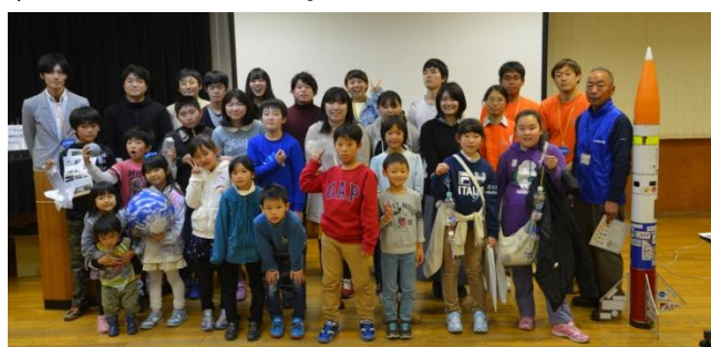
参加者で集合写真を撮りました

□千葉工大とサイエンスしよう 11月23日(水) 宇宙船作り、ロボット操縦、ロケットの構造を 知ろうなど6種類のを大学教授・学生と交流 を深めながら造りました。中でも大人はコマ まわし対戦に熱中、子どもはストラップを彩る模 様が電流の強弱で変化するのにビックリするなど 楽しんだ一日でした。