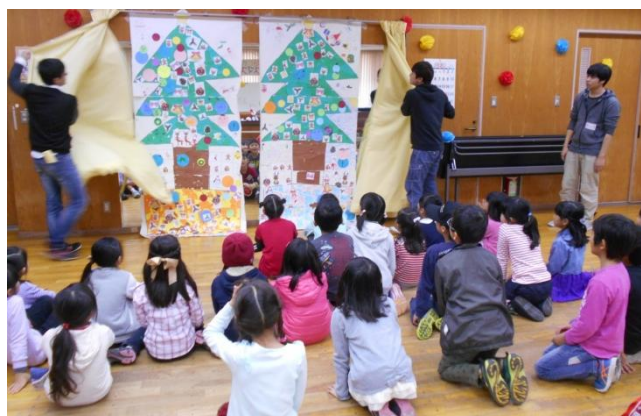
わーい！完成したあ

□みんなで作ろう！クリスマス 12月23日(金) 小学生とユースリーダー養成(公民館ボランテ ィアを育てる)の学生と共同でクリスマスパーテ ィーを行いました。公民館ボランティアのケアフ レンドの作ったサンドウィッチ、スープ、ババロ アを食べながら交流を深め、みんなで協力しなが ら製作した大きなツリーに歓声が上がりました。