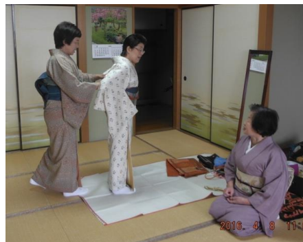
きれいに着られたかしら！？