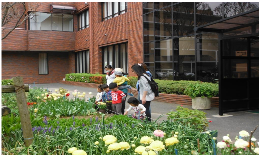
公民館の花壇に見入る親子連れ

公民館報 / 新習志野 編集 / 館報編集委員会 発行 / 新習志野公民館 指定管理者 株式会社オーエンス 習志野市秋津 3-6-3 TEL453-3400 http://sinnara-kominkan.net/